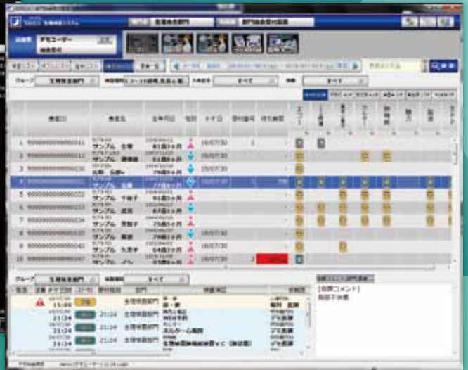
あらゆる生理検査を網羅

Sirius（シリウス）は多彩な検査が存在する生理部門をトータルに管理する生理検査システムです。各検査室の受付から検査機器の進捗情報をリアルタイムに表示し、各部屋への患者呼び込みの案内表示板機能にも対応しているため、患者の検査室への割り振りから誘導まで幅広くサポートします。